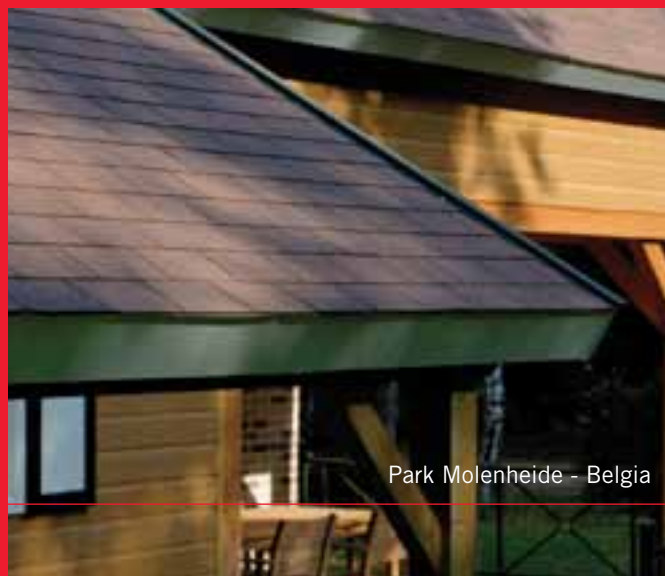
Park Molenheide - Belgia